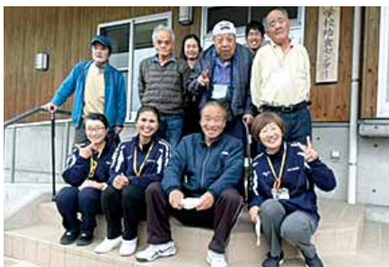
給食センター見学・試食会