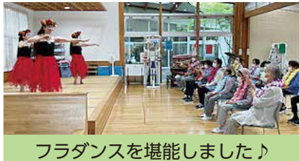
フラダンスを堪能しました♪