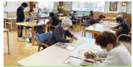
毎月カレンダー作成をしています。