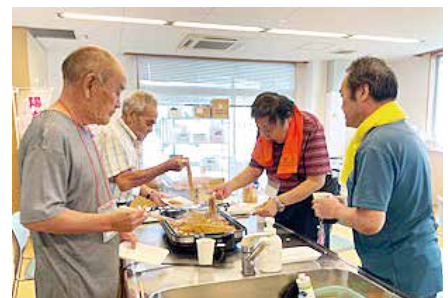
みんなで焼きそばを作りました♪