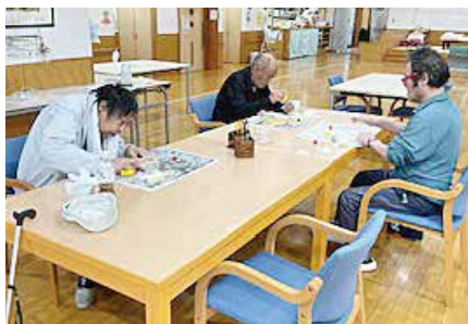
木材でお手製ペン立を作りました！