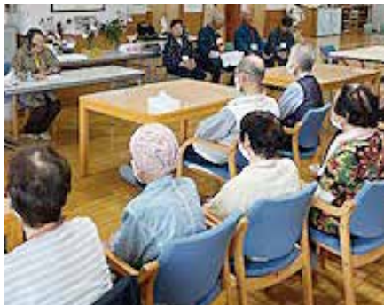
たなぐら語りの会さんから棚倉の昔話を聞きました。