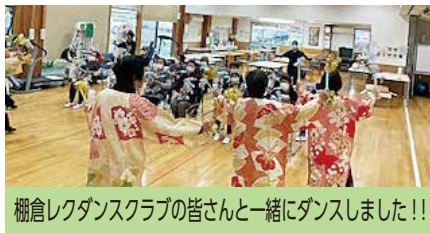
棚倉レクダンスクラブの皆さんと一緒にダンスしました!!