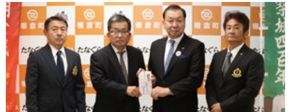
棚倉ライオンズクラブ 様

募金活動にご協力いただいた学校・事業所・各団体からの贈呈式の模様を掲載させていただきました。